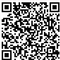
報名網址 QR CODE