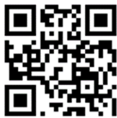
台灣性教育學會官網