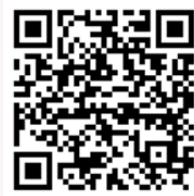
台灣性教育粉絲專頁