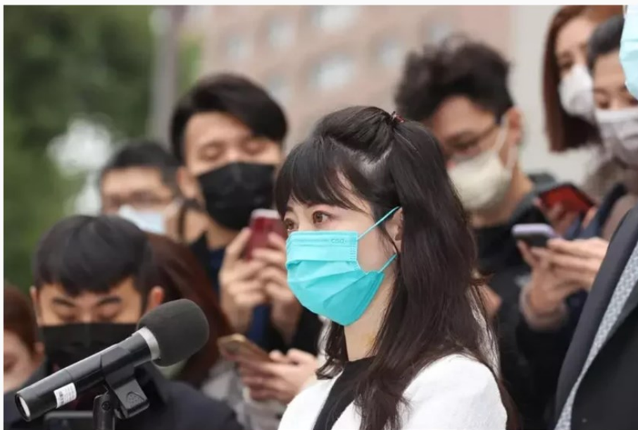
立委高嘉瑜上午在立法院舉行記者會，說明遭男友家暴經過時落淚眼眶泛紅。